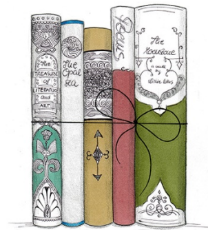
MENJAJ BRANJE IN SANJE